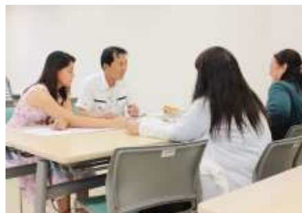
日本語少人数レッスン風景